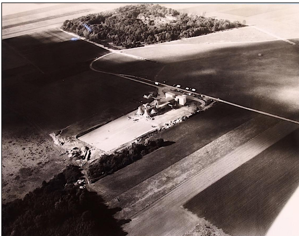
Figure 1. Photo aérienne de l'usine de compostage TRIGA de Versailles située à Buc, sur le plateau de Saclay au sud de Paris, en novembre 1966. L'usine est édifée au milieu des champs en grandes cultures qui dominant déjà largement le paysage agricole très spécialisé du plateau. Tout juste construite, elle n'a pas encore débuté son activité comme l'indique l'absence d'andains sur l'aire dédiée, à l'arrière de l'usine.

lui accorde une place très conséquente dès lors que l'on sort de la zone urbaine centrale (Paris et communes limitrophes) 23 .