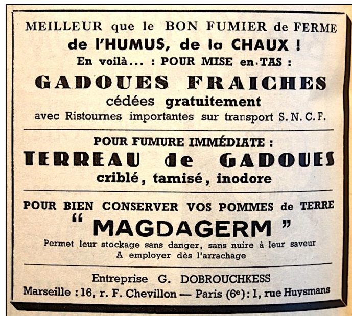
Figure 2. Assimilation des ordures ménagères au « bon fumier de ferme » dans une publicité de l'entreprise Georges Dobrouckess qui est chargée de l'évacuation des ordures de nombreuses communes franciliennes dans les années 1950. La propagande s'inscrit dans les « croisades de l'humus » et la promotion de la fertilisation calcaire (chaux) qui prend un large essor après-guerre.

l'heure des « croisades pour l'humus » 50 – est la manifestation la plus évidente de la référence aux savoirs, à la tradition et à l'autonomie paysanne pour la défense et l'établissement de la valeur des ordures traitées, qui se fait ainsi « au nom des souvenirs » 51 . Très répandue, elle se retrouve dans tous les discours ou presque ainsi que dans les publicités que l'on trouve dans les revues agricoles (figure 2). Les agronomes comme les ingénieurs sanitaires des entreprises spécialisées dans le compostage qui se développent à partir des années 1950 ne cessent de l'y comparer 52 , et mettent ainsi en avant ses qualités comparables voire, parfois, ses teneurs plus élevées en certains éléments et en matières organiques. L'argument est souvent renforcé par la raréfaction du fumier animal, de surcroît dans certaines régions comme la région parisienne ou la Champagne où la spécialisation et l'intensification toujours plus poussées des cultures évincent l'élevage 53 . On peut ainsi lire, entre autres formules similaires, que « pour l'agriculture [...] le compost des villes constituerait un substitut précieux de même valeur au moins que le fumier actuellement employé » 54 . Présenté comme « succédané » de ce dernier 55 , il se voit ainsi paré de qualités encore partiellement, mais de plus en plus résiduellement à mesure que s'imposent les engrais chimiques, reconnues par les cultivateurs.